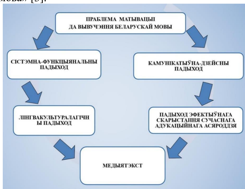
Малюнак 1. – Дыдактычны складнік праекта «Медыямова»

Дыдактычны складнік праекта «Медыямова» цалкам адпавядае падыходам і прынцыпам, сфармуляваным у канцэпцыі вучэбнага прадмета «Беларуская мова» [3].